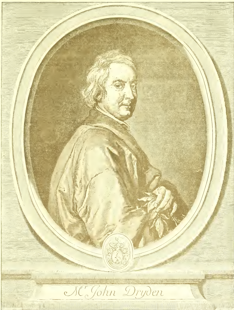
Mr John Dryden